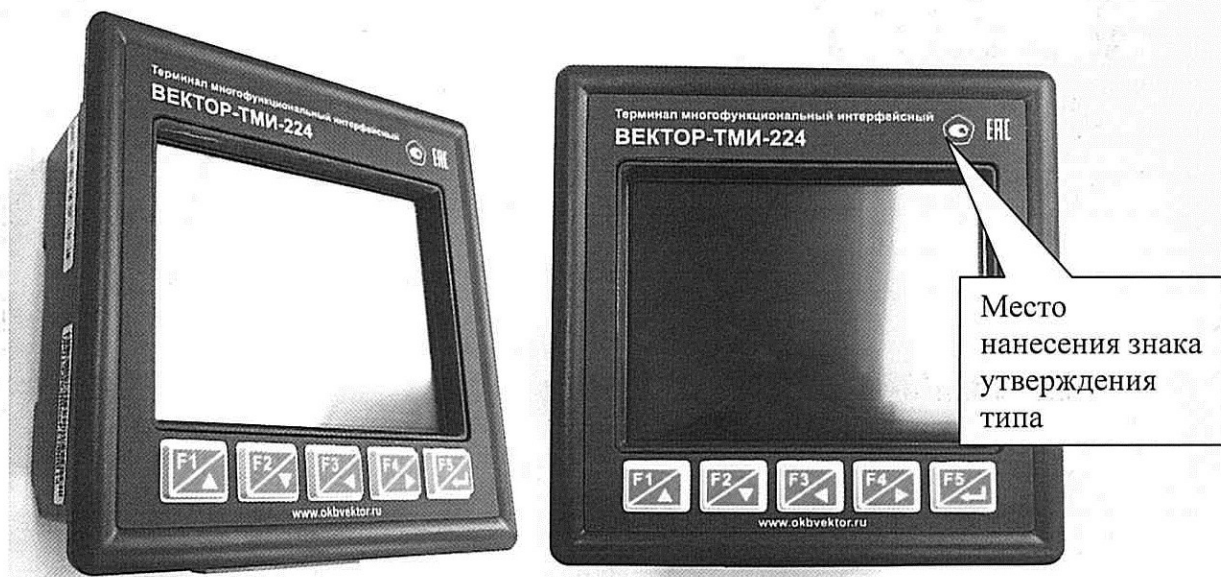
Рисунок 1 – Общий вид терминалов